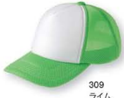
309 ライム ×ホワイト