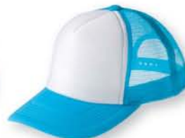
341 ターコイズ×ホワイト