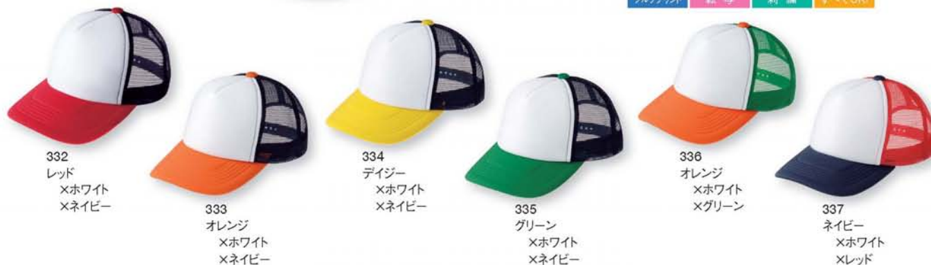
332 レッド ×ホワイト ×ネイビー