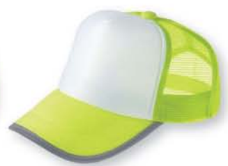
125 蛍光イエロー ×ホワイト