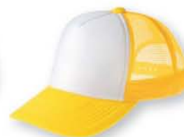
306 デイジー×ホワイト