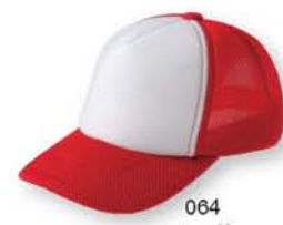
064 レッド ×ホワイト