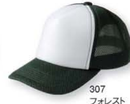
307 フォレスト ×ホワイト