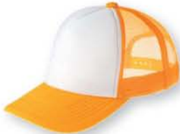
157 ゴールドイエロー×ホワイト