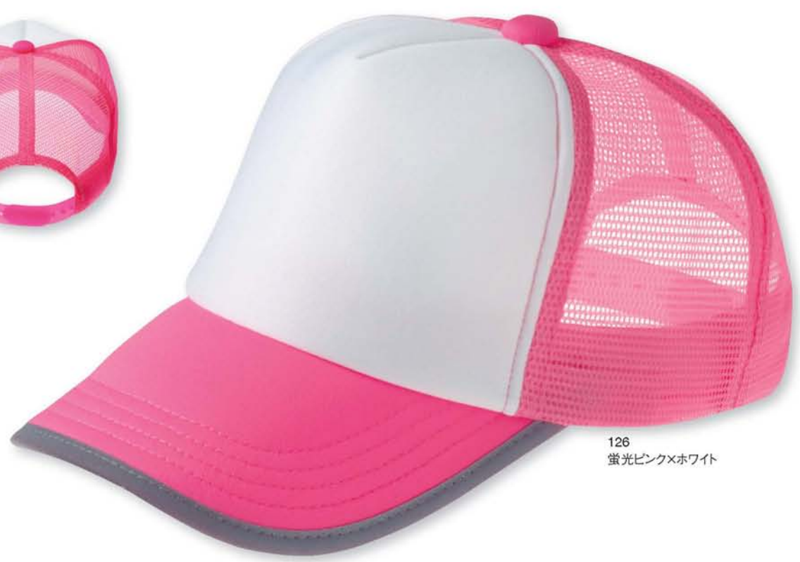
126 蛍光ピンク×ホワイト