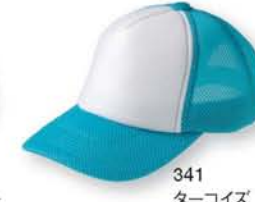
341 ターコイズ ×ホワイト