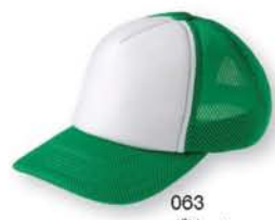
063 グリーン ×ホワイト