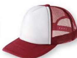
305 バーガンディ×ホワイト