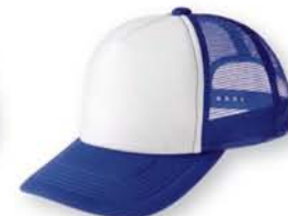
311 ジャパンブルー×ホワイト