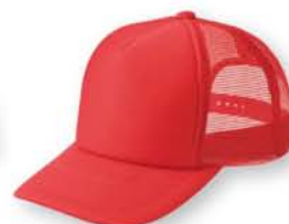
169 イタリアンレッド