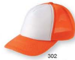
302 オレンジ ×ホワイト