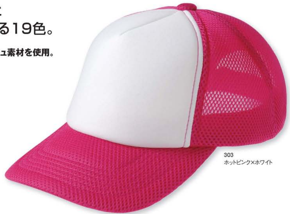
303 ホットピンク×ホワイト