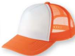
302 オレンジ×ホワイト