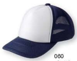
060 ネイビー ×ホワイト