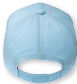
ジュニアサイズ 133 ライトブルー