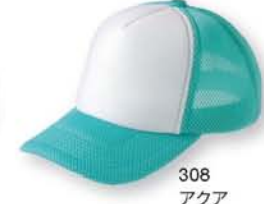
308 アクア ×ホワイト