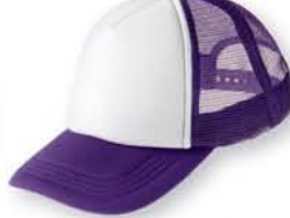
067 パープル×ホワイト