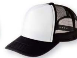
066 ブラック×ホワイト