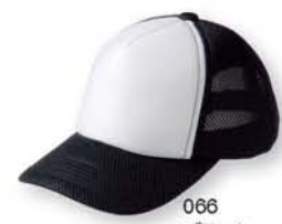
066 ブラック ×ホワイト