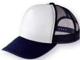
060 ネイビー×ホワイト