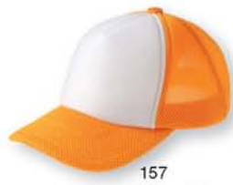
157 ゴールドイエロー ×ホワイト