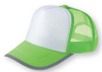
124 蛍光グリーン ×ホワイト