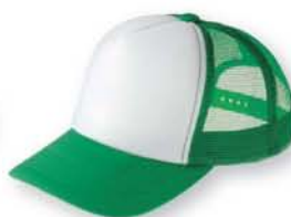
063 グリーン×ホワイト