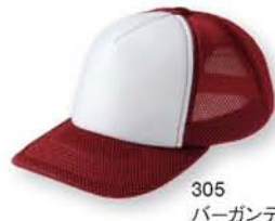
305 バーガンディ ×ホワイト