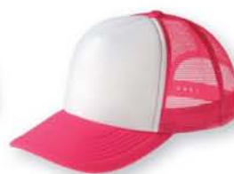
303 ホットピンク×ホワイト