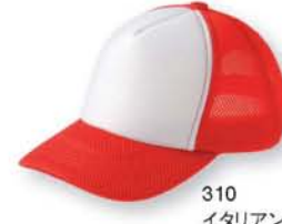
310 イタリアンレッド ×ホワイト