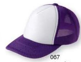
067 パープル ×ホワイト