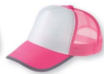
126 蛍光ピンク ×ホワイト