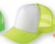
125 蛍光イエロー ×ホワイト