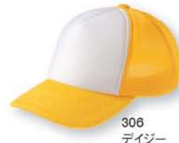
308 デイジー ×ホワイト