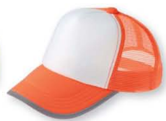
123 蛍光オレンジ ×ホワイト