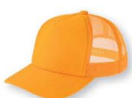
077 ゴールドイエロー