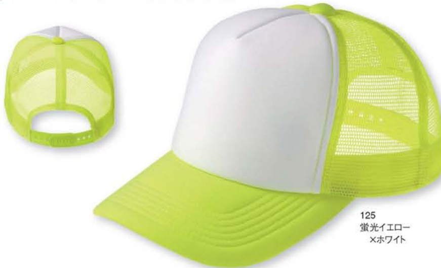
125 蛍光イエロー ×ホワイト