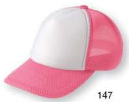
147 ピンク ×ホワイト