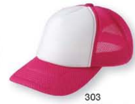
303 ホットピンク ×ホワイト