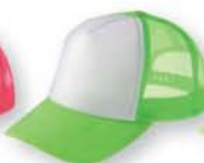
124 蛍光グリーン ×ホワイト