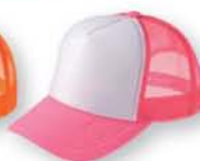
126 蛍光ピンク ×ホワイト