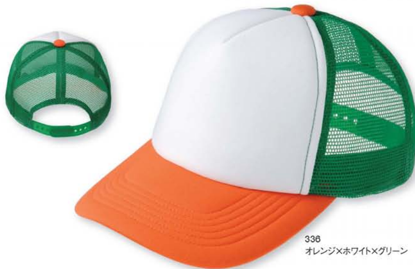
336 オレンジ×ホワイト×グリーン

ビビッドなスリートンカラーが鮮やかなカラフルメッシュキャップ。 前面のホワイトがアクセント。プリントするとさらに際立ちます。