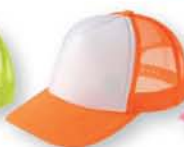
123 蛍光オレンジ ×ホワイト