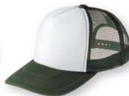
307 フォレスト×ホワイト