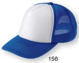
156 ロイヤルブルー ×ホワイト