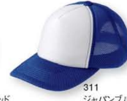
311 ジャパンプルー ×ホワイト