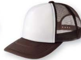
304 チョコレート×ホワイト