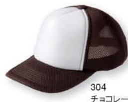
304 チョコレート ×ホワイト