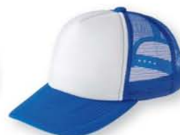
156 ロイヤルブルー×ホワイト