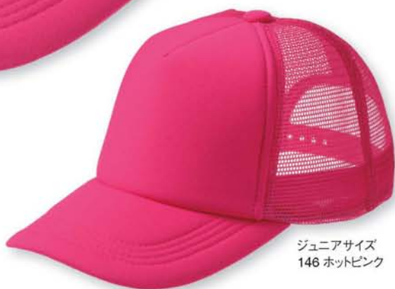
ジュニアサイズ 146 ホットピンク