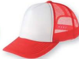
310 イタリアンレッド×ホワイト